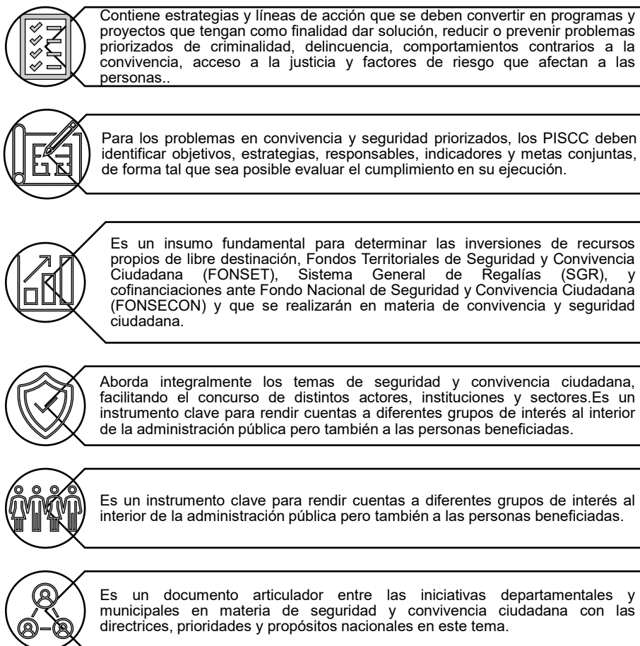
Ilustración 2 Consideraciones PISCC

Elaboración propia basado en la Metodológica para la formulación, implementación, seguimiento y evaluación de los planes integrales de seguridad y convivencia ciudadana 2024 de DNP.