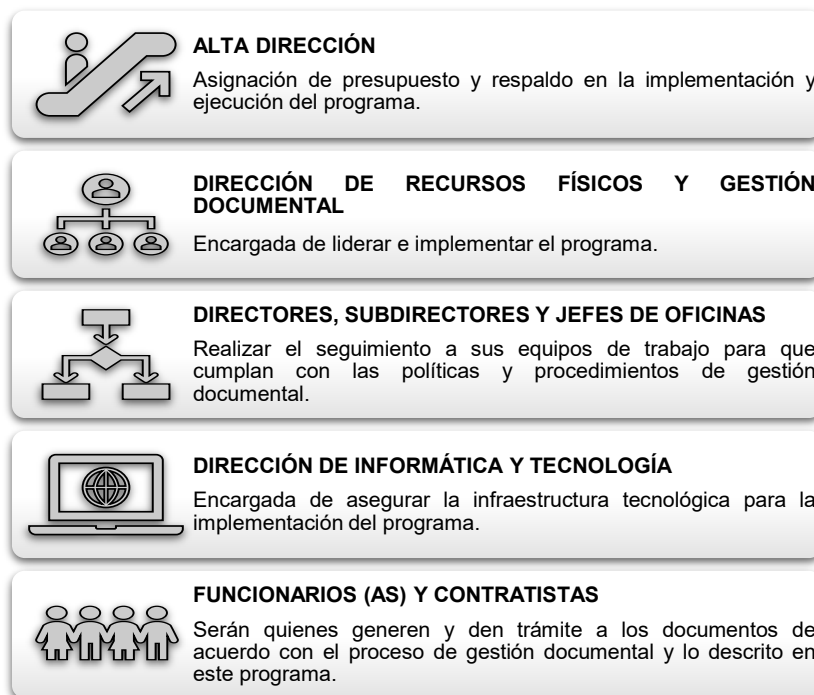
Ilustración 1. Actores responsables y su rol

Sin embargo, para una adecuada implementación del PGD, es importante definir los actores responsables, que tendrán los siguientes roles: