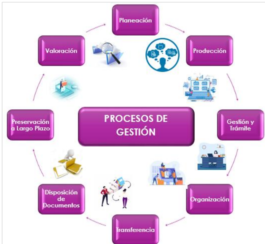
Ilustración 6. Procesos de Gestión Documental

Los lineamientos de la gestión documental están definidos en el artículo 8 del Decreto 2609 de 2012 y en el artículo 2.8.2.5.9. del Decreto 1080 de 2015 , dentro de la normatividad citada se definen ocho (8) procesos que interactúan en la gestión documental desde la producción hasta la disposición final de los documentos sin importar el tipo de soporte en que se generen, estos procesos son: