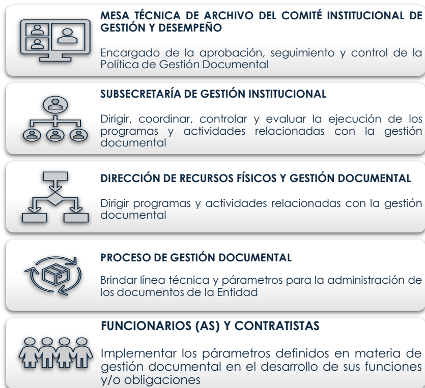
Ilustración 5. Recursos Administrativos

La Secretaría Distrital de Seguridad, Convivencia y Justicia en el 2018, con la Resolución 718