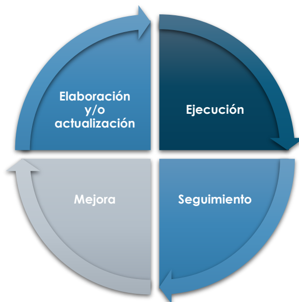
Ilustración 7. Fases de Implementación del PGD