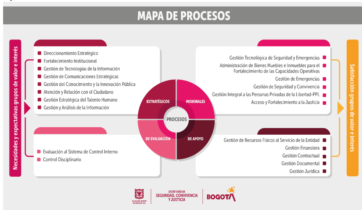
Imagen 1. Mapa de Procesos SDSCJ

En la siguiente imagen se presenta el mapa de procesos adoptado por la SDSCJ. El plan de gestión integral de residuos hospitalarios y similares se encuentra asociado al proceso estratégico Fortalecimiento Institucional, teniendo en cuenta que este tiene como objetivo administrar las actividades de implementación del Modelo Integrado de Planeación y Gestión (MIPG), dentro del cual se ubica el componente de Gestión Ambiental, liderado por la Oficina Asesora de Planeación.