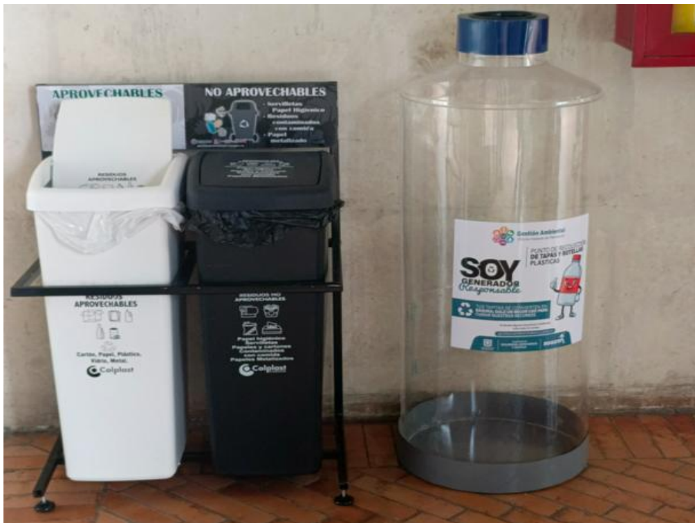
Imagen 2. Puntos ecológicos Cárcel Distrital